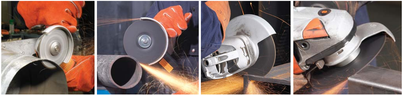
Corte de calibres delgados