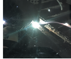
Visión HD ArcOne HD lente

Vea el color en su forma más verdadera con la exclusiva tecnología HD de ArcOne. Esta innovadora característica disponible con los lentes ArcOne en el ORBIT™ aumenta el rango de luz visible cuando se mira a través de estos lentes de soldadura. Esto significa que verá colores más naturales, proporcionando una visión más clara y definida de su área de trabajo.